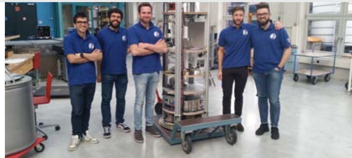
Sempre il quintetto con accanto l'interno della capsula