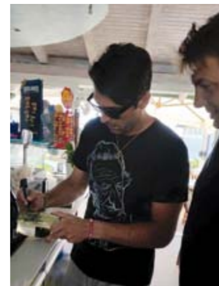
Il grande portiere autografa la nostra Ribolla Gialla